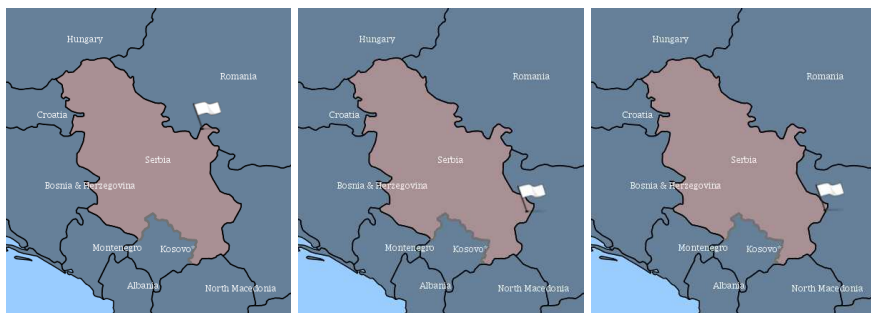
Χάρτης επιβεβαιωμένων κρουσμάτων ΑΠΧ έτους 2020 σε αγριόχοιρους στη Σερβία

Κατόπιν της παρατηρούμενης αύξησης στην καταγραφή εστιών της νόσου στη γειτονική Βουλγαρία αλλά και τη Σεβρία θα θέλαμε εκ νέου να επιστήσουμε την προσοχή όλων των αρμόδιων αρχών, φορέων, χοιροτρόφων και κυνηγών της χώρας στην τήρηση των αυστηρών μέτρων βιοασφάλειας κατά την εκτροφή χοίρων συμπεριλαμβανομένων των μετακινήσεων αυτών, και το κυνήγι (με έμφαση στον τρόπο χειρισμού των θηραμάτων και στη διαχείριση των προϊόντων εκδοράς), που έχουν πολλάκις επισημανθεί σε προγενέστερες εγκυκλίους της Υπηρεσίας μας.